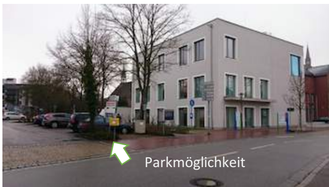
Sicht von Nürnberg/ Stuttgart

Befahren Sie die A9 Richtung Norden – am Autobahnkreuz 65 Dreieck Holledau fahren Sie auf die A93 Richtung Hof/Regensburg/Wolnzach – danach nehmen Sie die Ausfahrt 46 Bad Abbach und fahren Richtung Bad Abbach immer geradeaus – dabei wird die Römerstr. zur Kaiser-Heinrich-II.-Str. – nach einer Rechtskurve finden Sie uns auf der rechten Seite im Raiffeisenbank-Gebäude. Der Eingang befindet sich im Vorhof links.