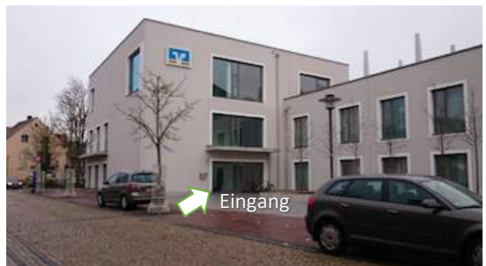
Sicht von München

Internet-Link zum Routenplaner Google Maps: http://t1p.de/link-zu-googlemaps